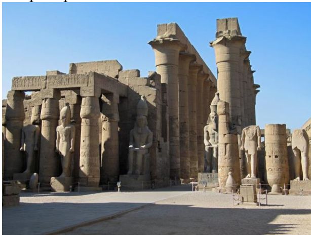
Храм в Луксоре