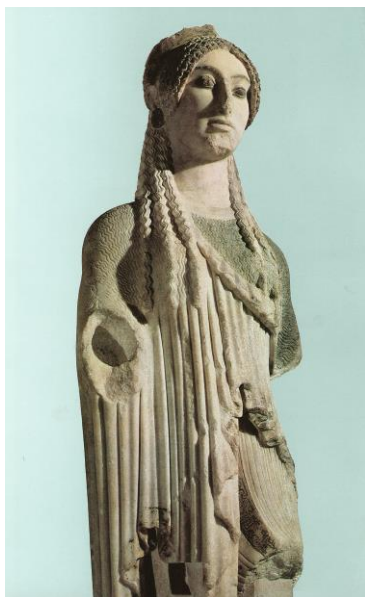
Архаическая кора (Кора 647)